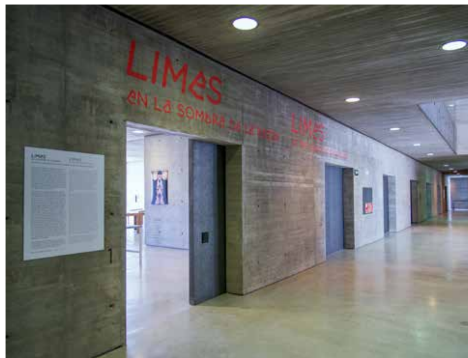
Acceso a la exposición.