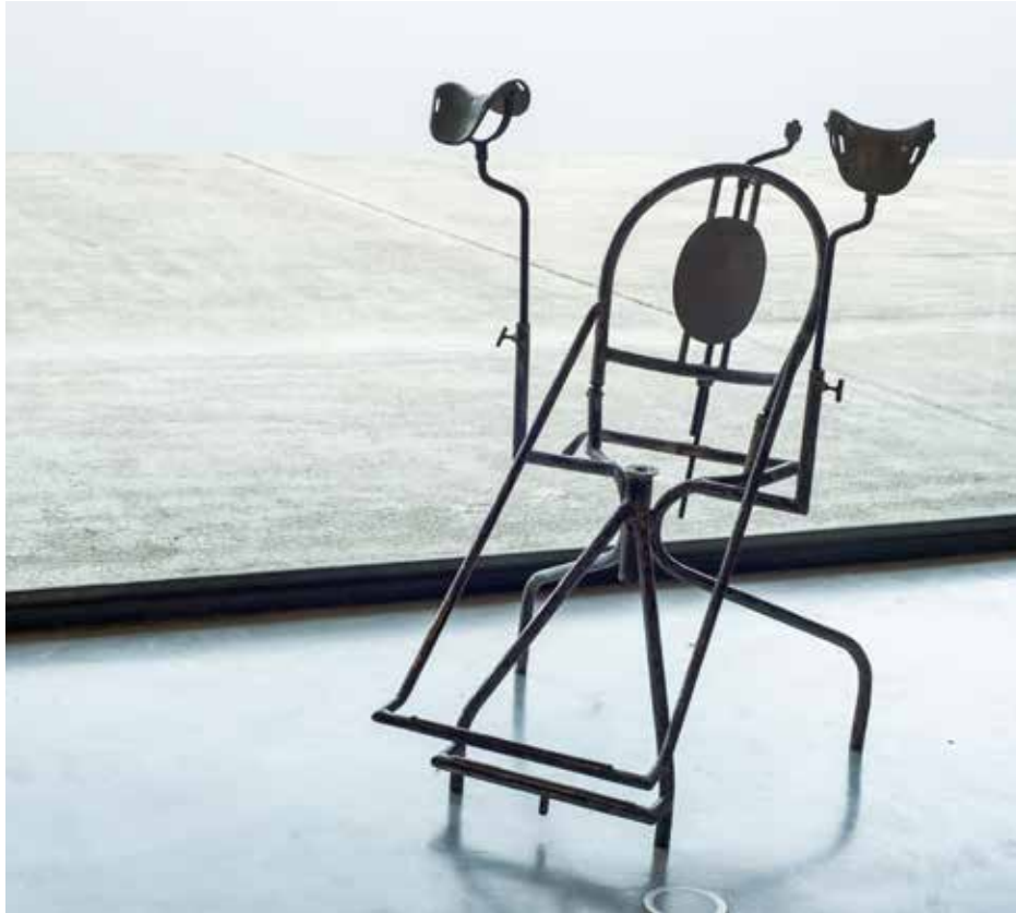
Dos Bengalas. Match.

Match (2020) es el trabajo realizado en su residencia que gira en torno al amor como herramienta, una decisión poética y aparentemente cursi que desvela las fórmulas actuales en el cortejo y la búsqueda de pareja, sexo y encuentros amorosos entre personas desde el contexto virtual de las redes sociales. Convierten al propio edificio del C3A en un usuario más de estas aplicaciones y como dos ventrílocuas, conciertan citas con diferentes personas de la ciudad. En la muestra, sobre la propia mesa de trabajo, se distribuyen impresas las capturas de pantalla de los diferentes diálogos y acompaña a esta instalación un vídeo de carácter narrativo que explica los resultados. Como testimonio de lo vivido, se instala de forma extraña en el espacio doméstico una silla ginecológica, que nos sitúa en una de las experiencias reales que el colectivo ha vivido en las citas realizadas con los usuarios de estas aplicaciones.