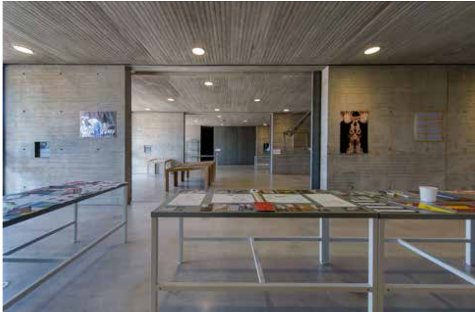
Vista general de la exposición.

¿Y si por un momento ponemos énfasis en el público? ¿Existe un público para estas manifestaciones creativas? ¿Existe una pedagogía sobre este fenómeno artístico? ¿Quién hace la obra, el consumidor o el creador? La activación, como gesto que provoca la esencialidad del arte público, viene del público que debe actuar como un conmutador que adopta la capacidad de control desde un mismo lugar. De alguna manera, como una construcción simultánea entre el público y el creador. El arte público desde la posición frontal de un gran espejo cóncavo que viene a reflejar una nueva realidad, donde de forma perimetral nos sitúa en otra escala, esta vez enfatizando aspectos que quizás estaban ocultos, como una cata arqueológica, extrayendo a la superficie nuevas lecturas del contexto más próximo y ayudando de alguna manera a resituarnos en el hoy y en el aquí.