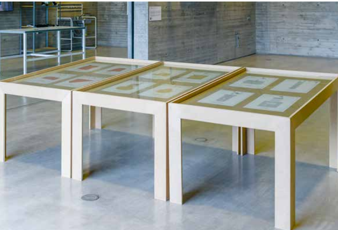
Arquitectura a Contrapelo. Plazas.