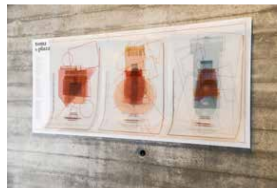
Arquitectura a Contrapelo. Plazas .