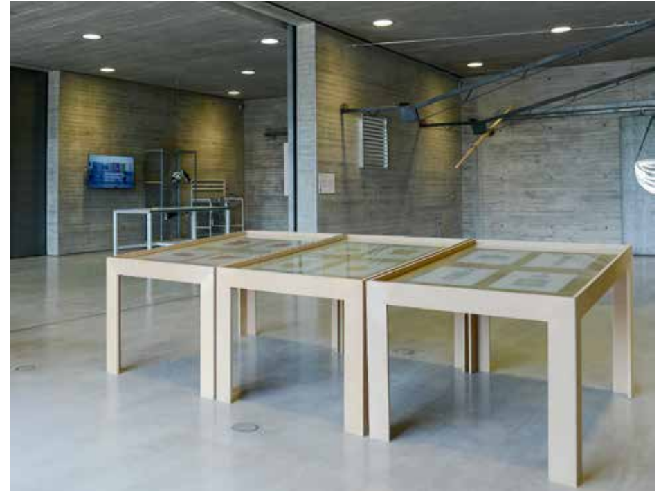
Arquitectura a Contrapelo. Plazas.

El colectivo sevillano Arquitectura a Contrapelo nace como espacio blog en 2012 y lo componen los jóvenes arquitectos Pedro Mena, Miguel Rabán y Juan Luis Romero. El propio nombre del mismo parte de una expresión tomada del filósofo Walter Benjamin, quien en su tesis aboga por el total distanciamiento de un devenir histórico al servicio de los vencedores y propone “pasarle a la historia el cepillo a contrapelo”. Arquitectura a Contrapelo invita desde sus curiosas propuestas a releer, reinterpretar y redibujar el mundo en el que entiende y defienden sus prácticas, vinculando el juego como fórmula de aprendizaje y crecimiento en numerosos proyectos. Sus intereses se enfocan hacia la divulgación de los valores propios de la arquitectura, antes que la propia creación in situ de nuevos modelos. Desde sus inicios han marchado con un carácter científico y descubriendo realidades que han unificado con astucia y elegancia aspectos lúdicos y gráficos. Partiendo del conocido juego de construcción que en 1924 realizara Alma Siedhoff-Buscher en la Bauhaus , en su página web se presentan una serie de productos/juegos como Scala , Order o Expo , donde nos encontramos ante una fórmula de producción que antepone el conocimiento al cemento.