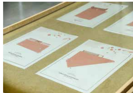
Arquitectura a Contrapelo. Plazas .