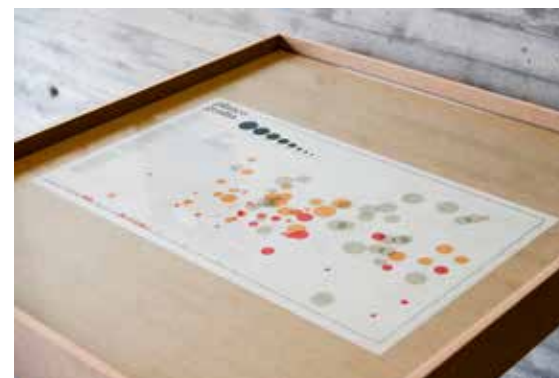
Arquitectura a Contrapelo. Plazas .