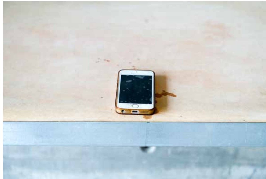
Dos Bengalas. Match.

Match (2020) es el trabajo realizado en su residencia que gira en torno al amor como herramienta, una decisión poética y aparentemente cursi que desvela las fórmulas actuales en el cortejo y la búsqueda de pareja, sexo y encuentros amorosos entre personas desde el contexto virtual de las redes sociales. Convierten al propio edificio del C3A en un usuario más de estas aplicaciones y como dos ventrílocuas, conciertan citas con diferentes personas de la ciudad. En la muestra, sobre la propia mesa de trabajo, se distribuyen impresas las capturas de pantalla de los diferentes diálogos y acompaña a esta instalación un vídeo de carácter narrativo que explica los resultados. Como testimonio de lo vivido, se instala de forma extraña en el espacio doméstico una silla ginecológica, que nos sitúa en una de las experiencias reales que el colectivo ha vivido en las citas realizadas con los usuarios de estas aplicaciones.