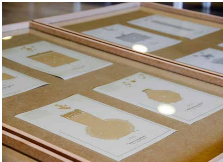
Arquitectura a Contrapelo. Plazas .

Acompañando y sumado a este discurso, el colectivo ha producido un juego inédito titulado Toma la plaza , que se compone de una serie de diseños impresos en acetatos que al solaparse construyen nuevas formas y fórmulas de estos espacios públicos.