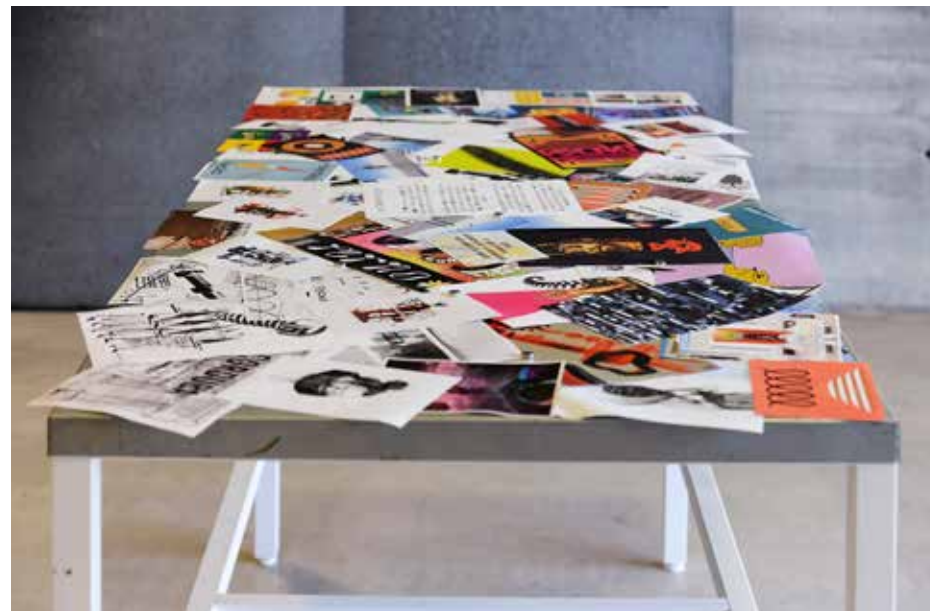
Sota Pérez. Perno 2020 .